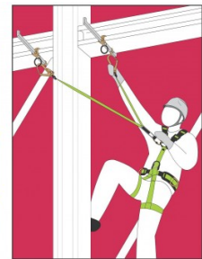
Lattice metallic structure Structure métallique