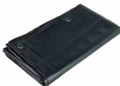
Verde Mate T75M