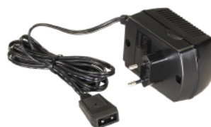
Cargador 230V AC