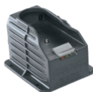
Base de carga