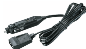
Cargador 12V DC coche